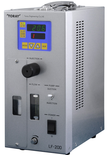
※写真は卓上型（オプション）